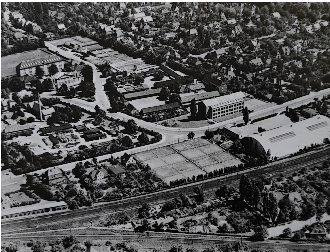
Luffoto fra 1948 af Bregnegårdsvej

Ungdomsskolen holder til i historiske bygninger, mellem Maglegårdsskolen og Gentofte Gymnasium i Hellerup, Her var der tidligere udkørsel efter dagrenovation. Kranhallen blev konstrueret til eftersyn af hestevogne. Vi skal høre om husets historie i foredragssalen og om ungdomsskolens arbejde. Efterfølgende får vi en rundvisning i de historiske bygninger.