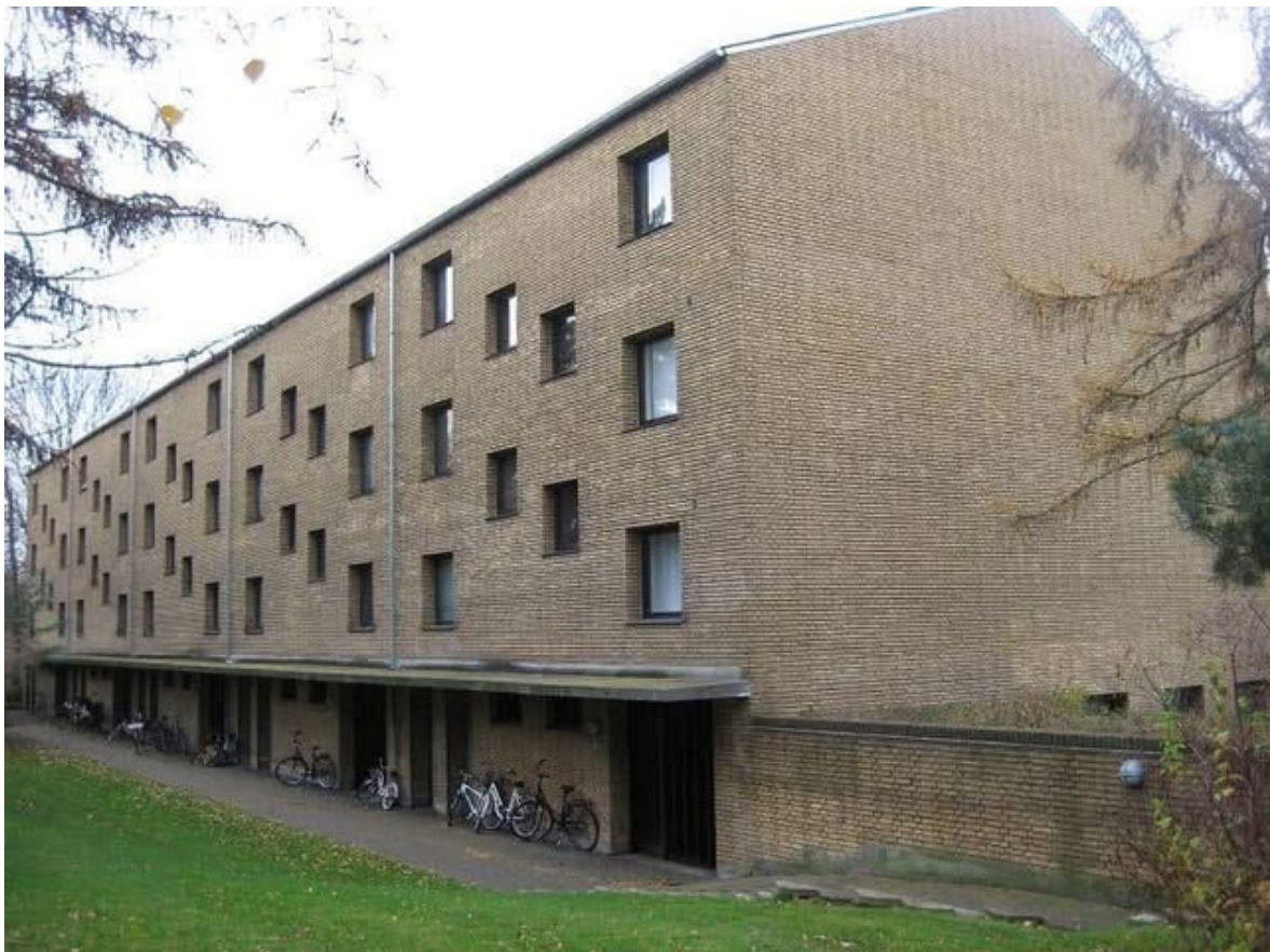
Ved Ungdomsboligerne Gentofte